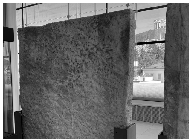
生々しく残るノミの跡。均等にノミを入れて平坦にした作業の足跡が感じられる