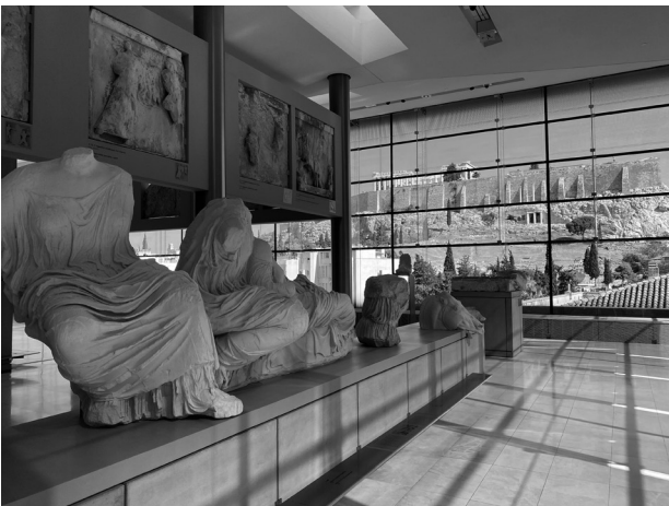
アクロポリスミュージアムから望むパルテノン神殿

例えば、カサバトリヨという150年前に作られた建物は海をイメージして作られています。室内の木製両開きの扉が海の表現のために3次元に曲がっています。普通扉といえば板状のものですが、複雑に曲がりくねった形はなん