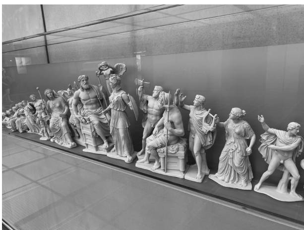
神殿の屋根を飾っていた彫刻群（レプリカ）

「コロンビア社会が政治腐敗で大変なのでこちらに来た」と言うと、一気に彼の声のトーンが低くなったことを感じました。そして言葉のリズムまでも変わりました。そのリズムに乗れ